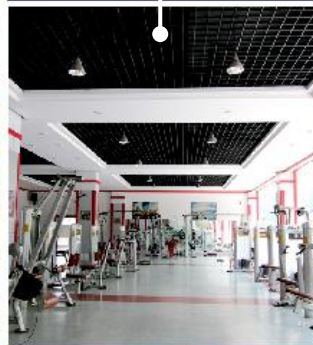
Кафе на первом этаже общежития