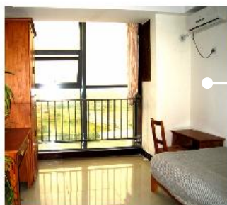
Комната на одного человека

Общежитие иностранных студентов находится на территории кампуса, рядом с учебным корпусом иностранных студентов.