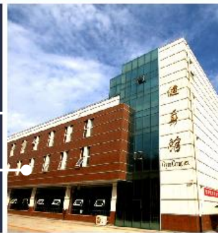
Общежитие иностранных студентов